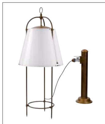
Art. TWIL3 Art. TWIL/PAL Art. INT.M